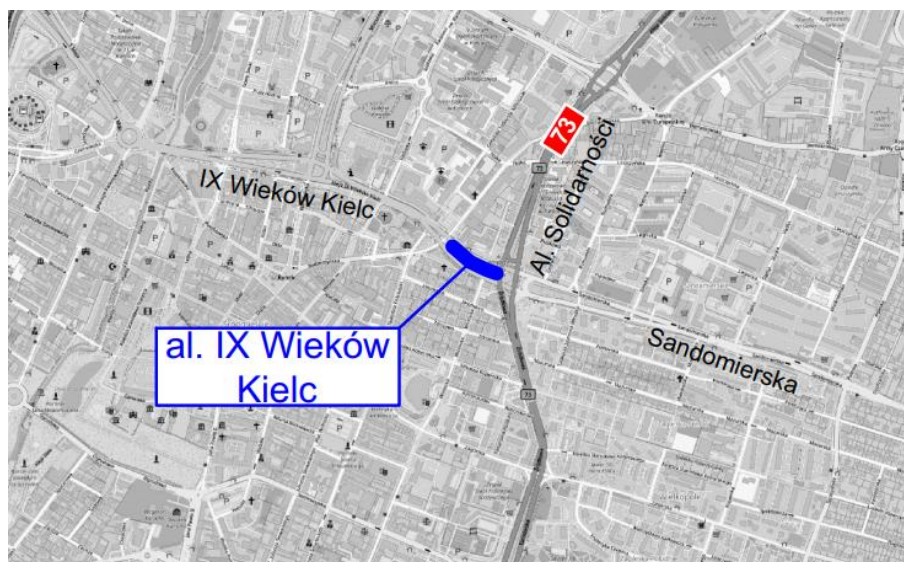
Rys 1. Plan orientacyjny.

Obszar planowanej inwestycji obejmuje al. IX Wieków Kielc na odcinku od ul. Starodomaszowskiej do al. Solidarności (centralna część Kielc).